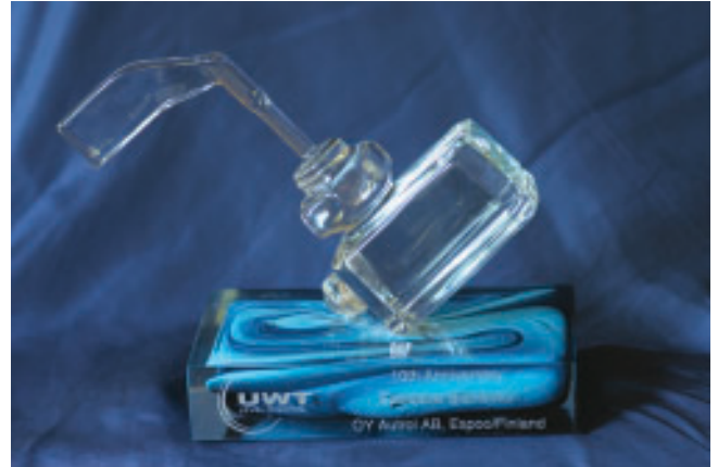
Autrolin palkinto 10 vuoden edustajatyöstä

Kokouksessa palkittiin parhaiten UWT:n tuotteita myyneet Belgian ja Italian edustajat. Autrolilla on UWT:n myyntitilastossa viides sija. Autrol palkittiin vanhimpänä ulkomaanedustajana, yhteistyö UWT:n kanssa on kestänyt jo yli 10 vuotta. Palkkioksi saimme Maltalaisesta lasista valmistetun Rotonivo-kytkin patsaan (katso. kuva alla).