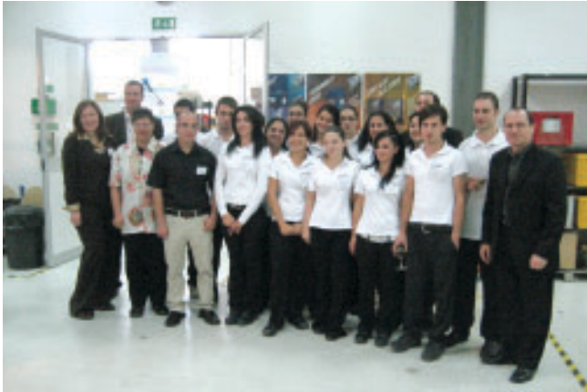
UWT:n Maltan tehtaan henkilökunta

Etelä-Saksalainen pinnanvalvontalaitteita valmistava UWT piti kolmannen kansainvälisen edustajakokouksen Maltalla. Kokoukseen osallistui noin 60 edustajaa 26:sta eri maasta. Kokous pidettiin ensimmäistä kertaa Maltalla, jossa UWT:llä on oma vuonna 2001 perustettu tehdas. Tehdas työllistää 35 henkeä (katso kuva alla) Tehtaalla valmistetaan ROTONIVO-pintakytkimien erikoismallit.