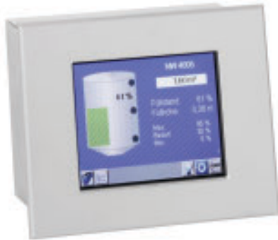
NIVOTEC 1000 kosketusnäyttö

Pinnanmittauksen kokonaiskuva saadaan näkyviin uudella Nivotec:n näytöllä. Saksalainen UWT on kehittänyt uudet digitaaliset valvontajärjestelmät, joista pienempi NT1000 on varustettu 5,7" kokoisella kosketusnäytöllä. Järjestelmään voidaan kytkeä enintään 8 kpl analogiamittauksia ja 14 kpl kosketinviestejä. Laitteeseen on mahdollista kytkeä myös Modbus-laitteita. Näytöllä voidaan valvoa siilojen pinnankorkeuden ylä- ja alarajoja. Järjestelmästä saadaan myös trendinäytöt.