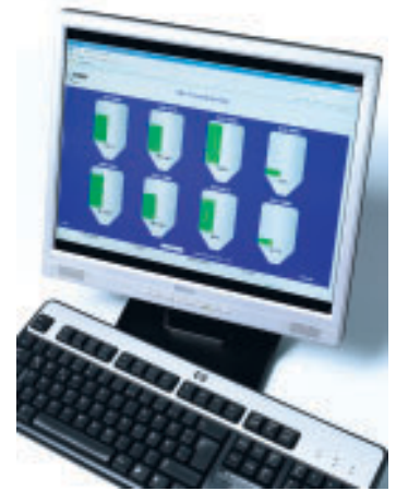
NIVOTEC 3000 PC-grafiikanäyttö

Laite esitellään Tekniikka 2008 -messuilla Jyväskylässä 1.-3.10.2008 osastolla B 211.